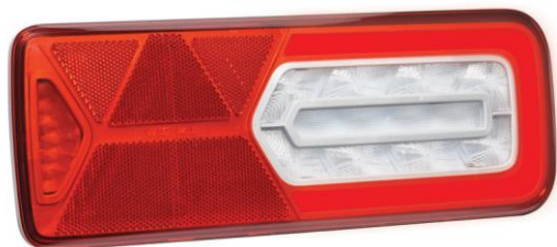
Вариант для прицепов