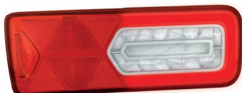
Вариант для грузовых авто